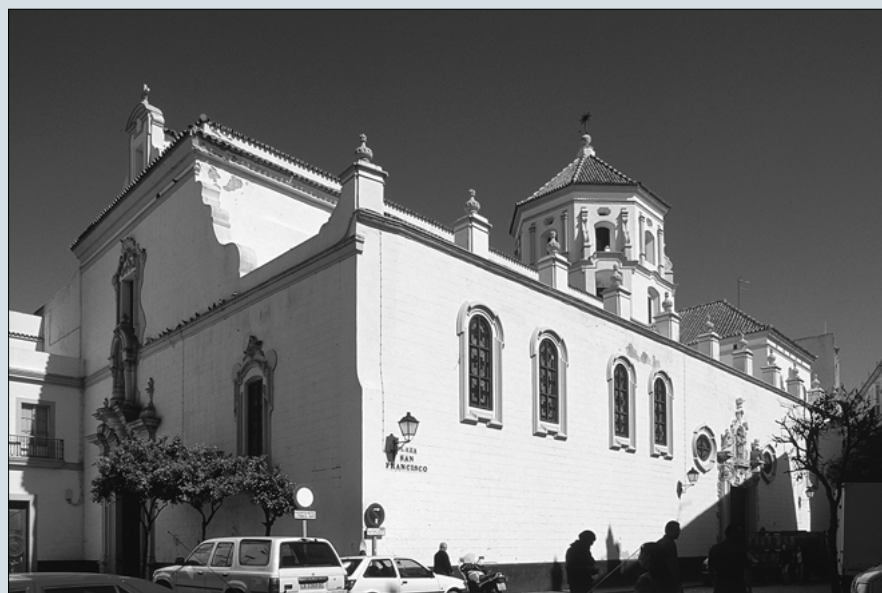
Convento de S. Francisco. Cádiz

1992. Desde entonces se ha producido un notable incremento tanto en el número de los monumentos seleccionados como en el de los visitantes. Los temas que han desarrollado las Jornadas durante este período han sido muy variados. Así, los dos primeros años se centraron en monumentos integrantes del Patrimonio Histórico Andaluz donde se habían realizado obras de restauración y, en general, poco conocidos o de difícil acceso. En el año 1994 se eligió como motivo "El legado romano en Andalucía" y en 1995 se realizó una Jornada de Puertas Abiertas sobre el tema "La cultura islámica en Andalucía". En 1996, se eligió el tema "Patrimonio y Ciudad"; en 1997, "Los Castillos en Andalucía"; y el pasado año se ocuparon de "Los Museos y las Catedrales de Andalucía".