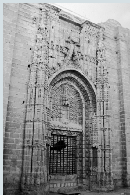
Monasterio de la Victoria. Puerto de Sta. María (Cádiz)

La participación de la Comunidad Autónoma Andaluza en estas Jornadas comenzó en